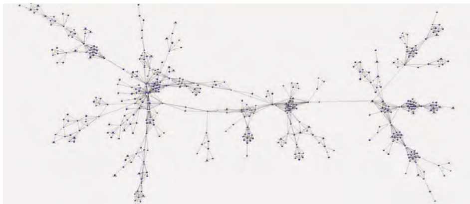
Diagrama 1. Red donde se vinculan 426 casos a partir del empleo de 119 armas de fuego.

de conexiones donde se vinculan 426 casos a partir del empleo de 119 armas de fuego. Cada punto representa un evento criminal y cada línea de enlace el empleo de por lo menos una misma arma de fuego en ambos hechos.